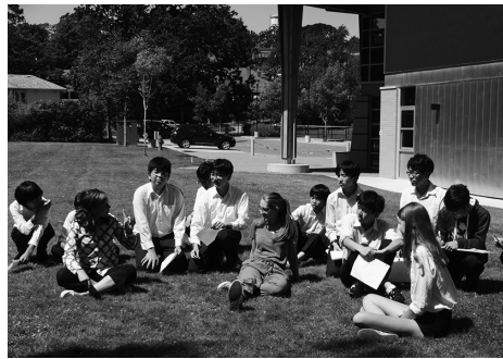
高校1年生全員参加のカナダ研修

世田谷学園の6年間は、中学1・2年生を前期(1・2年)、中学3年・高校1年生を中期(3・4年)、高校2・3年生を後期(5・6年)として位置づけ、大学現役合格を意図した進路別・学力別のカリキュラムを組んでいます。とくにコンパス(各教科の学習指針を示したもの)を学年別にWeb上で閲覧でき、自主的・計画的に学習が進められるようにしています。