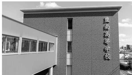
2016年に完成した第二校舎・体育館