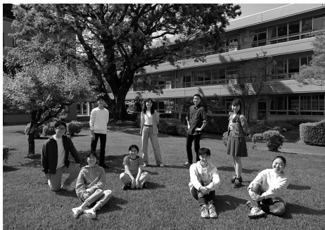
方によるものです。