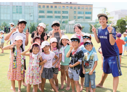
子ども理解活動の様子

「改組に至った背景の一つには、コロナ禍による教育方法の変化があります。場所の制限がないオンライン授業が普及したのは収穫でしたが、その一方で海外の人々との直接的な交流は希薄になりました。本学には外国語学部があり、これまでにグローバル企業就職へとつながる実績が高く評価されています。しかし、