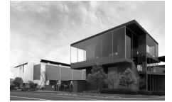
「創立百周年記念館」完成イメージ

2026年には多機能教室を備える3階建ての「創立百周年記念館」が竣工予定。次の100年を見据え、さらなる学習環境の充実に努めます。