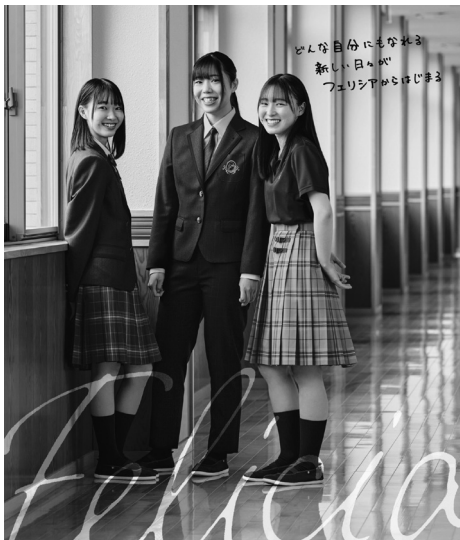
フェリシア高等学校

フェリシアは、鮮やかなブルーが爽やかな印象を与える可愛らしい花です。そして「幸福」「恵まれている」という花言葉を持ちます。「恵み」という言葉は、聖書の中で繰り返し使われる大切な言葉です。神様は皆さん一人ひとりのありのままを、無条件で受け入れてくださり、神の恵みは無限に注がれています。本校では「建学の精神」の基幹となる『愛の教育』をもって、一人ひとりの個性を大切に、目をかけ、手をか