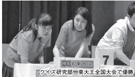
クイズ研究部 東大王全国大会で優勝

アへのALと展開していきます。このような活動を通して、主体的な学習態度やプレゼンテーション能力を育むことが目的です。