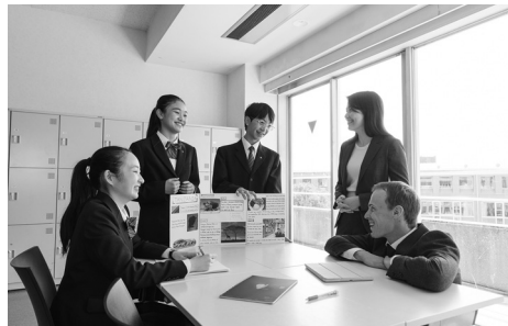
今年の進学実績については巻末の「高校別大学合格者数一覧」をご覧ください

〈貢献〉とは、三田国際学園の学びの姿勢です。授業を聞き、ノートに書き写して覚え、先生が求めているであろう予定調和的な答えにたどり着くことだけでは〈貢献〉ではありません。自分自身で考え、自分の意見を表明することこそ、クラス全体の学びに貢献できるという考え方です。〈貢献〉によって醸成される学園の文化は、豊かな水をたたえる大地のように、生徒の文化は、世界へと羽ばたいていくための力をぐんぐん伸ばしていきます。