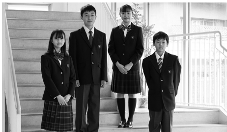
2023年度入学生から制服リニューアル

英語については、基本的な学習法の習得、学習習慣の形成からいねいに指導します。授業は、「書く・読む・聴く・話す」の英語4技能をバランスよく取り入れて展開していきます。発信型の英語を身につけ、グローバル社会で活躍できるコミュニケーション能力を育成します。英会話の授業はネイティブ教員がオールイングリッシュで行います。また、ゲームやスピーチ、スキット(寸劇)、プレゼンテーション、ディベートなどさまざまなスピーチ活動を行って「話す」技能を伸ばします。その結果、中学1年修了時点の英検4級以上の取得率は92%となっており、中には2級・準2級を取得している生徒もいます(2023年3月現在)。