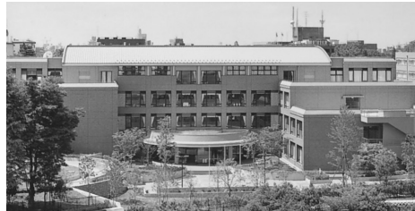
災の基礎知識に関する授業が行われています。