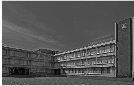
2018年に完成した新1号館