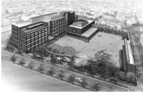
校舎全景図 合格者数はこの10年で飛躍的に上昇しています。