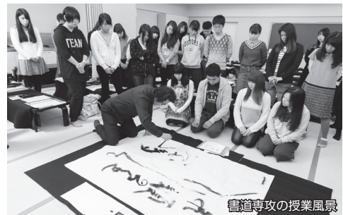
書道専攻の授業風景

国際政治経済学部 本学部は「国際政治経済学科」と「国際経営学科」の2学科を設置しています。国際的・学際的な学びが特長で、英語教育や情報教育も重視し、有能なビジネスマンを育成します。「国際政治経済学科」