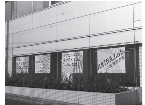
「都市文化デザイン学科」の拠点『アキバ・ラボ』

国際交流センターを窓口として、北京大学(中国)、ダブリンシティ大学(アイルランド)、ケンブリッジ大学(イギリス)等への短期海外語学研修、及び、海外協定校(中国、韓国、台湾、オーストラリア)への1年間の派遣留学を実施。(前年度実績)