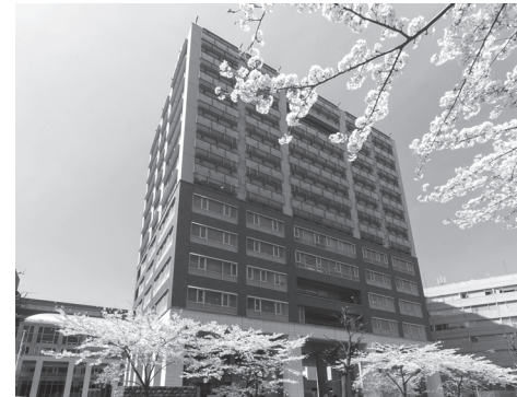
春の九段校舎1号館

／司書／学芸員 ※小学校教諭2種免許状は「小学校教員養成特別プログラム」の履修により取得可能。都市文化デザイン学科及び国際経営学科では教員免許は取得できません。(教職課程は再課程認定申請予定)