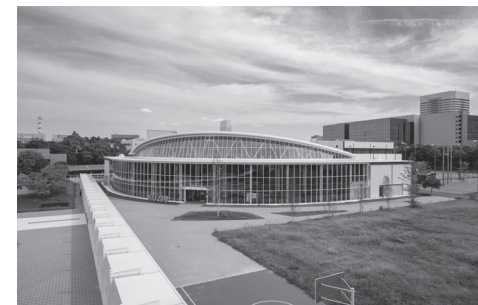
新施設8号館「KUIS 8(クイスエイト)」

◆多言語コミュニケーションセンター「MULC(マルク)」 神田外語大学で専攻できる、英語以外の7つの言語エリアとインターナショナルエリアで構成されるフロア。各エリアは、それぞれの特徴となる町並みや建造物