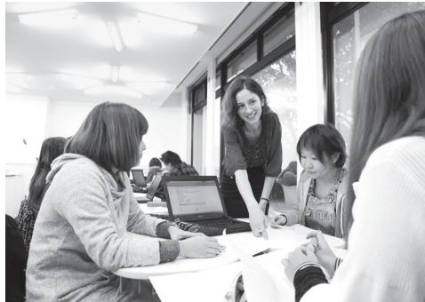
語学必修科目授業風景

〈国際コミュニケーション学科〉 国際コミュニケーション専攻では、ディベートやプレゼンテーションの技法、メディアリテラシーなど、自ら発信できる知識と技能を