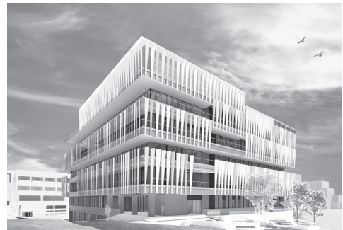
STREAM Hall 2019 (2020年3月完成予定)

さらに農・工・芸術学部の3学部が融合する新たな学びの拠点として「STREAM Hall 2019 (2020年3月完成予定)」、大学に隣接した女子寮 (2019年4月入寮開始予定) の建設が決定しています。新たな学修施設が続きと完成を迎え、教育環境がさらに充実!