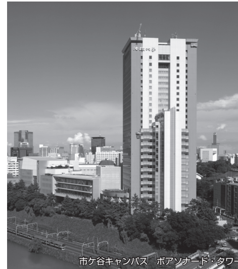
市ヶ谷キャンパス ボアソナード・タワー

ERP(英語強化プログラム)を通じて高い英語力を養成するとともに、国際ボランティア・国際インターンシップへの参加機会を提供しています。「派遣留学制度」では、派遣先の授業料を全額免除するほか奨学金を支給(70万～100万円)し、留学先大学で修得した単位を卒業所要単位として認定しています(条件有)。