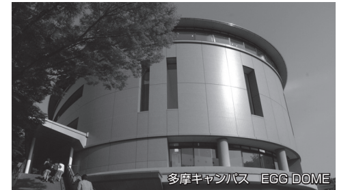
多摩キャンパス EGG DOME

心おきなく学業に取り組めるよう、独自の奨学・奨励金制度が充実しています。 〔法政大学独自の奨学金〕新・法政大学100周年記念奨学金、法政大学評議員・監事奨学金、チャレンジ法政奨学金(入試出願前予約採用型給付奨学金)、成績最優秀者奨学金、認定海外留学奨学金、各学部SA(スタディ・アブロード)奨学金 ほか