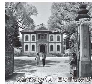
大宮キャンパス 国の重要文化財

部は2020年4月「先端理工学部」へと新しく生まれ変わります(設置構想中)。IoTやAIなどの新しい技術を駆使して社会的な課題を解決する、未来の技術者・研究者を育成するため、従来の理工学の枠を越え、先端技術を学ぶ6課程を設置。また、専門分野だけでなく、異分野の知識、異分野同士を融合させる力や主体的に学ぶ力を身につけるため、横断的な学びを促進する25の多彩なプログラムを用意しています。