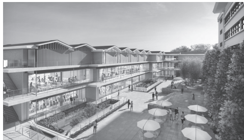
新校舎完成予定パース