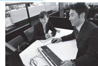
実績30年の「就活担任制」で一人ひとりの就職活動をしっかりサポート

桃山学院大学の就職支援の最大の特長が「就活担任制」です。求職登録を行った学生一人ひとりにキャリアセンター担当がつき、進路選択の相談から履歴書添削、面接対策まで個別にバックアップするシステムです。30年以上にわたり受け継がれたこの制度により、2019年度の就職希望者に対する決定率は全国平均を上回る98.0%。毎年安定した就職決定率を保っています。