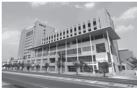
▲本キャンパス(JR小山駅東口前、徒歩1分)