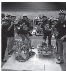
NHK学生ロボコン出場

※詳細は、ものづくり大学ホームページ等でご確認ください。個別での大学見学も随時受け付けておりますので、お気軽にご連絡ください。