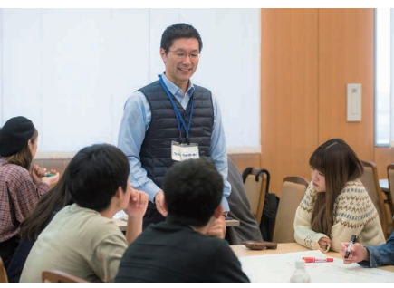
日本大学ワールド・カフェ (N-MIX)

のすべての学生を重要なキャリア育成期間と捉え、日本一の総合大学としての利点を生かした全学的な支援を行っています。約80名の就職支援スタッフが、大学本部と各学部とで密に連携しながら、学生ひとり一人を親身にサポートし、満足度の高い就職をめざします。 頼りになるのが、日本一の校友ネットワークです。日本大学の卒業生は約122万人を数え、社会のあらゆる分野で活躍する卒業生の実績とバックアップによって、在学生の就職活動を支えています。 また約8万件に及ぶ企業情報や、約3万件の求人情報のほか、卒業生情報や先輩の就職活動報告など有益な就職情報が得られる「NU就職ナビ」は、日大独自のサイトで日大生のみが利用可能となっています。 このように、日本一の総合大学としてのスケールメリットを生かした充実の支援態勢が、「就職力が身に付く日本大学」として高く評価される理由となっているのです。