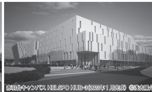
赤羽台キャンパス HELLSP0 HUB-3(2023年1月完成) ©浅高陽介