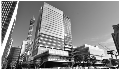
「人」が集い、「知」が交流するみなどみらいキャンパス

横浜みなどみらい21地区初の総合大学のキャンパスとして、2021年4月に誕生しました。経営学部、外国語学部、国際日本学部のグローバル系3学部の拠点となっています。地域や世界、人や情報につながる「知の拠点」を象徴する「ソーシャルcommons」は1階~3階へ広い空間があり、ここでは研究者、企業、観光客などさまざまな「人」が集い、学生は地域や社会とつながります。