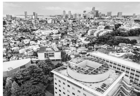
2023年、神奈川大学のすべての学部が横浜エリアに集結

日本有数の機械工作センター、建築構造実験室、走査性トンネル電子顕微鏡など、高度な研究施設と最先端の設備を備え、分野横断的に学ぶことができます。2022年新設の建築学部では、理系に限らず、まちづくり、生活デザインなどを含めた文・理融合の「建築学」を学修でき、2022年12月に建築学部の新工房を設置。このほか校内では世界水準をめざした研究・新拠点への環境改善が着々と取り組まれています。2022年図書館をリニューアル(県内最大級150万冊の蔵書)。「知的体験ゾーン」として、皆さんご利用ください。