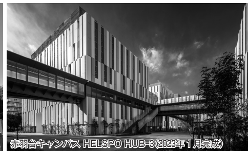
赤羽台キャンパス HELSP HUB-6(2023年1月完成)