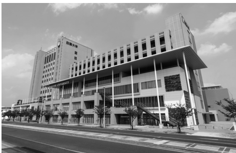
▲本キャンパス (JR小山駅東口前、徒歩1分)