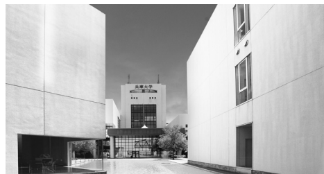
校教諭一種免許「保健体育」