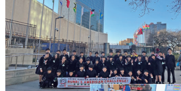
6年生アメリカ研修～国連本部前での記念撮影(上)／現地校の生徒たちに、英語で日本文化を伝える(右)