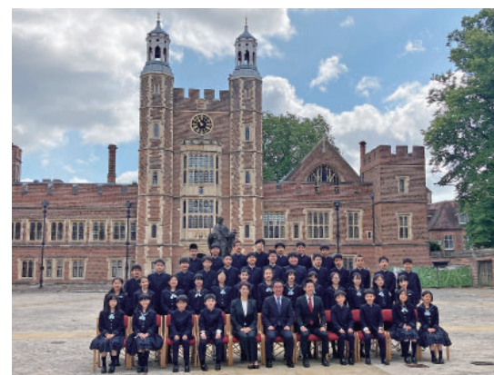
5年生イギリス短期留学～イートン・カレッジを訪問

「海外での体験を通して、子どもたちは初めて英語が世界中の人々とのコミュニケーションを取るためのツールであることに感動します。それが学びへのモチベー