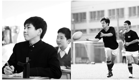
文武両道を目指す

四年制大学への進学希望者はほぼ100%。国立大学と早稲田・慶應・上智・東京理科大の合格者数(浪人を含む)は、19年416、20年453、21年494、22年453、23年507となっています。近年は国公立上位校や私立難関校への志向が一層強まり、医歯薬系の進学希望者も増えています。